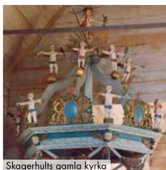
Skagerhults gamla kyrka