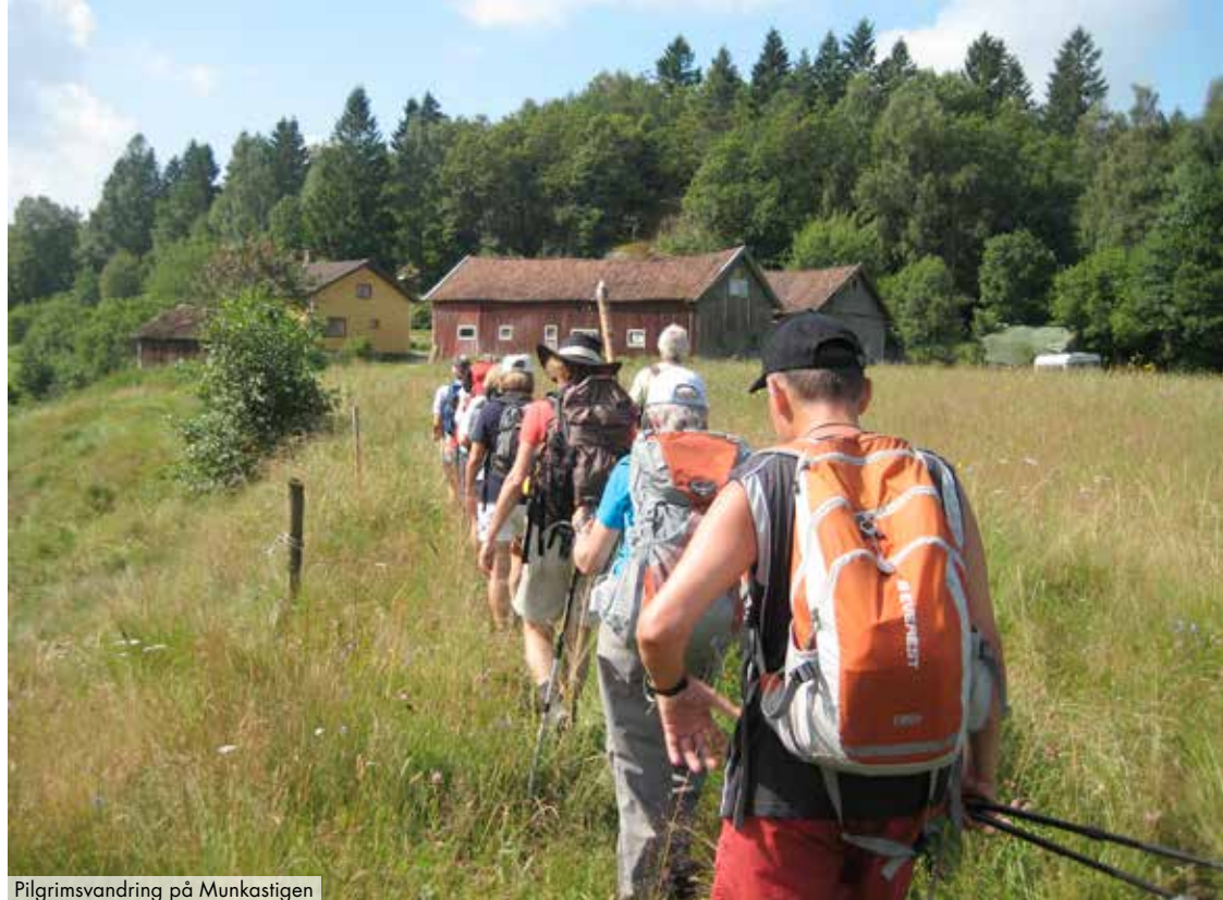
Pilgrimsvandring på Munkastigen